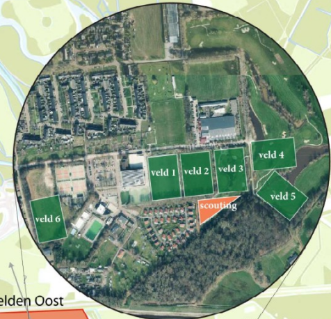
Mogelijke clustering sportvelden+scouting